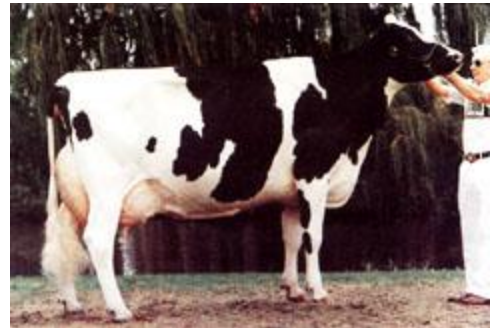
Raza productora de leche.